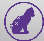
Skinn + hår