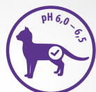
Skydd för urinvägar